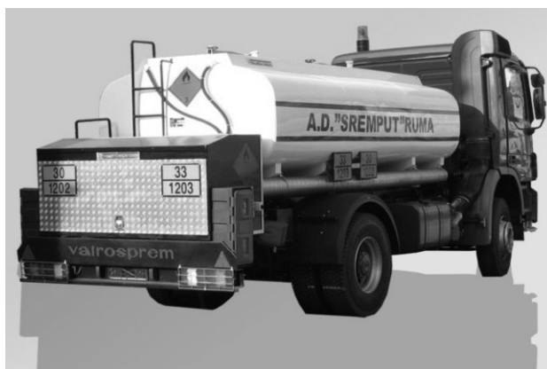
Slika 3.3. Propisno obilježeno vozilo za cestovni transport naftnih derivata

Transport opasnih materija zahtjeva veće mjere opreza nego što je to pri pakiranju i skladištenju. U prijevozu postoje i dodatni rizici, kao što su djelovanje promjenjivih sila, promjene klime te eventualne prometne nezgode koje mogu izazvati prave katastrofe uzrokovane djelovanjem opasnih materija. Stoga, postoje mnogi međunarodni propisi o prijevozu opasnih tvari, kojima je utvrđena klasifikacija, način označavanja i uvjeti kojih se mora pridržavati tokom prijevoza. Prijevoz opasnih materija u cestovnom prometu po BiH određuje se posebnim zakonom o prijevozu opasnih materija, ali za međunarodni i domaći promet zakonom se predviđa i korištenje međunarodne konvencije i to Evropski sporazum o cestovnom prijevozu robe u međunarodnom prometu (ADR). ADR klasifikacija identična je klasifikaciji u željezničkom prometu RID-u. Na slici 3.3. prikazano je propisno obilježeno vozilo za cestovni transport naftnih derivata. 30