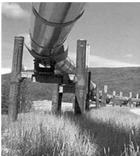
Slika 3.1. Naftovod na površini zemlje