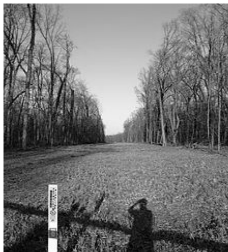
Slika 3.2. Naftovod ispod površine zemlje

Na slici 3.1. prikazan je naftovod izgrađen na površini zemlje od nehrđajućeg čelika. Cijevi su sa unutrašnjim presjekom od 30 do 120 cm. Gdje god je moguće, grade se na površini zemlje radi lakše kontrole i održavanja. Naftovodi se, također, mogu graditi i pod zemljom, kao što je to prikazano na slici 3.2. Ovakve načine gradnje naftovoda zahtjevaju uvjeti u okolini, kako bi se izbjegle situacije prelaza preko puteva, parkova, estetski zahtjevi itd. Naftovodi koji se grade pod zemljom obično su ukopani na dubinu od 1 do 1,8 m.